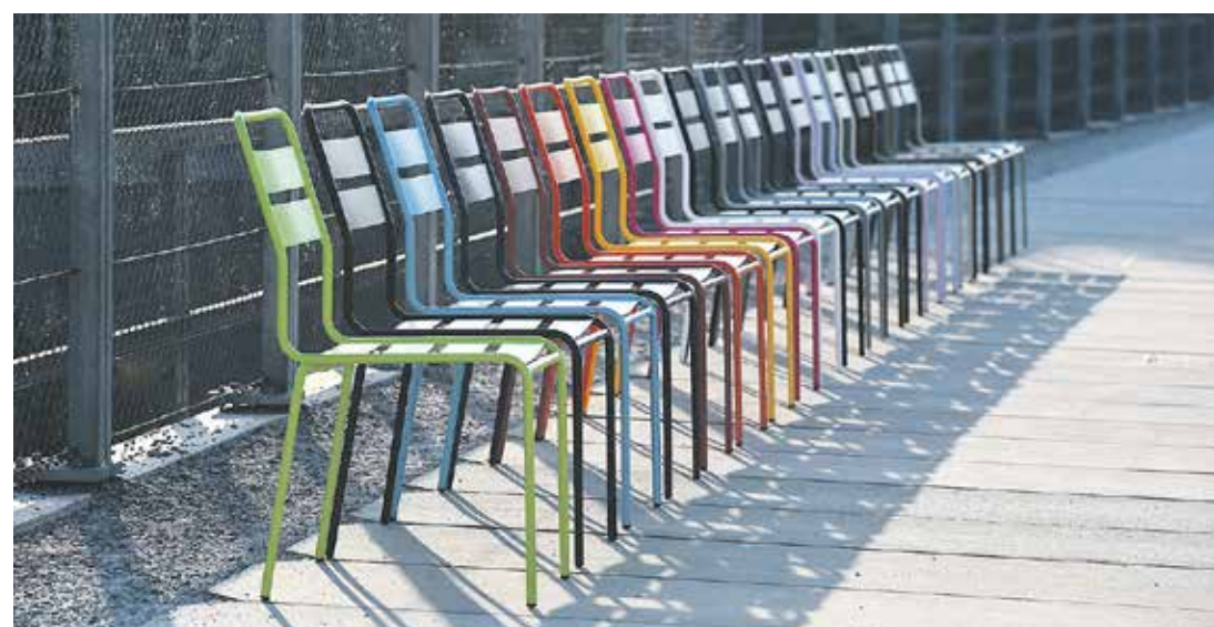
Ein farbenfroher Hingucker sind die Gartenmöbel des Schweizer Herstellers Schaffner.

Der Autor vertreibt das Buch in seinem eigenen Inno-Verlag und kann one line bestellt werden unter www.inno-verlag.ch