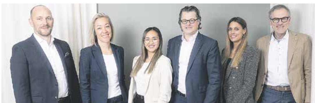
Global vernetzt, national tätig, in Winterthur angekommen: Das Ginesta Team für den Verkauf und die Vermarktung von Immobilien aller Art.